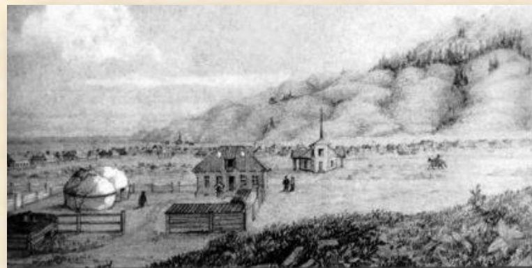
Рис. 1. Панорама с видом на военное укрепление Верное. 1857 год

числе построек выделяется здание церкви (см. Рис. 1) и рисунок с изображением самой церкви (см. Рис. 2).