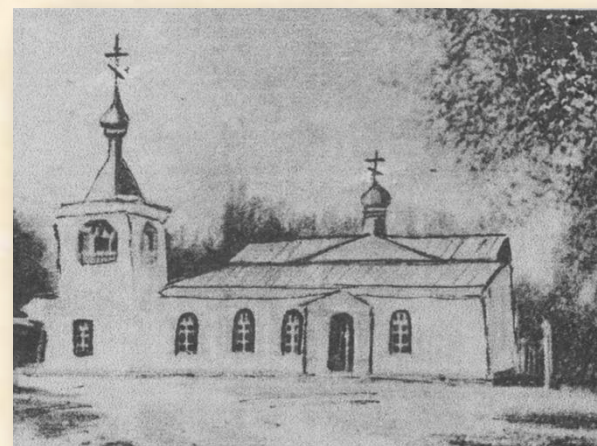
Рис. 2. Первая капитальная церковь, построенная на территории военного укрепления